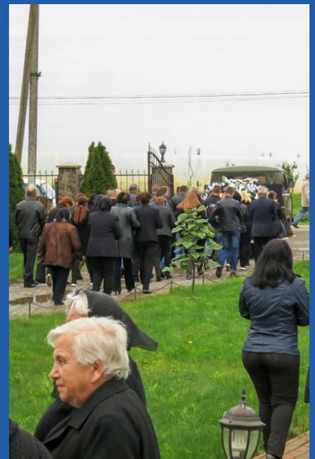
GRAF VAN EEN GESNEUVELDE MILITAIR