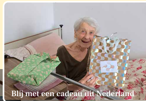
Blij met een cadeau uit Nederland