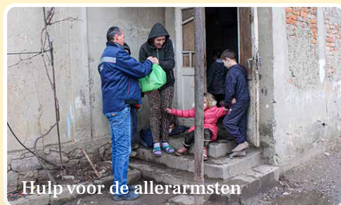
Hulp voor de allerarmsten