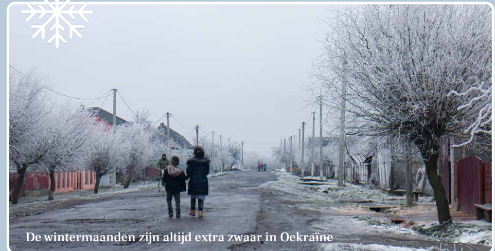
De wintermaanden zijn altijd extra zwaar in Oekraïne

Heeft u dit krantje uit....? Geef 'm door!