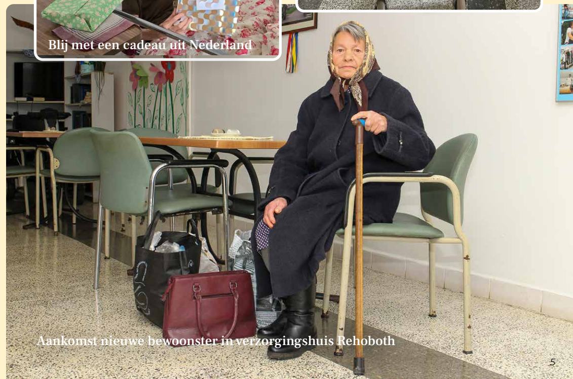
Aankomst nieuwe bewoonster in verzorgingshuis Rehoboth