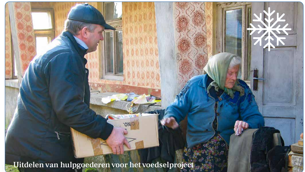
Uitdelen van hulpgoederen voor het voedselproject