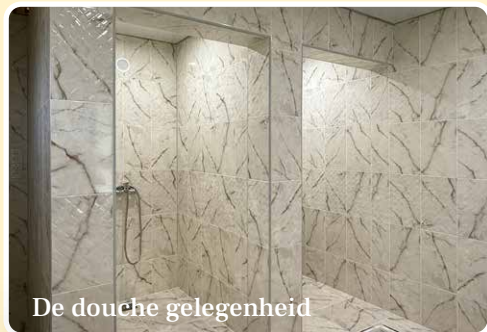
De douche gelegenheid

meester is gevraagd om nog een calculatie te geven van de kosten. Als het nodig is, kan Stichting OZO wellicht nog wat extra's bijdragen aan het project. Burgemeester Nagy liet weten heel blij te zijn met de bijdrage van Stichting OZO. Wie een extra gift wil geven voor het jubileumproject kan dit via het bankrekeningnummer van Stichting OZO doen (zie pag.2) onder vermelding van 'Jubileumproject'.