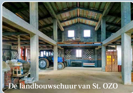
De landbouwschuur van St. OZO