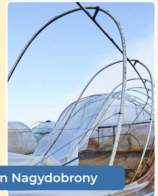
Grote schade in Nagydobrony