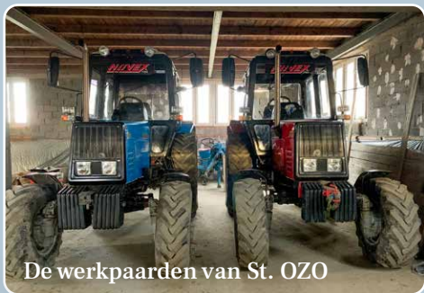
De werkpaarden van St. OZO

De komende maanden zal de kerkboerderij worden overgedragen aan de kerk. De verschillende landbouwwerktuigen die eigendom van Stichting OZO zijn, verhuizen naar de schuur achter Rehoboth.