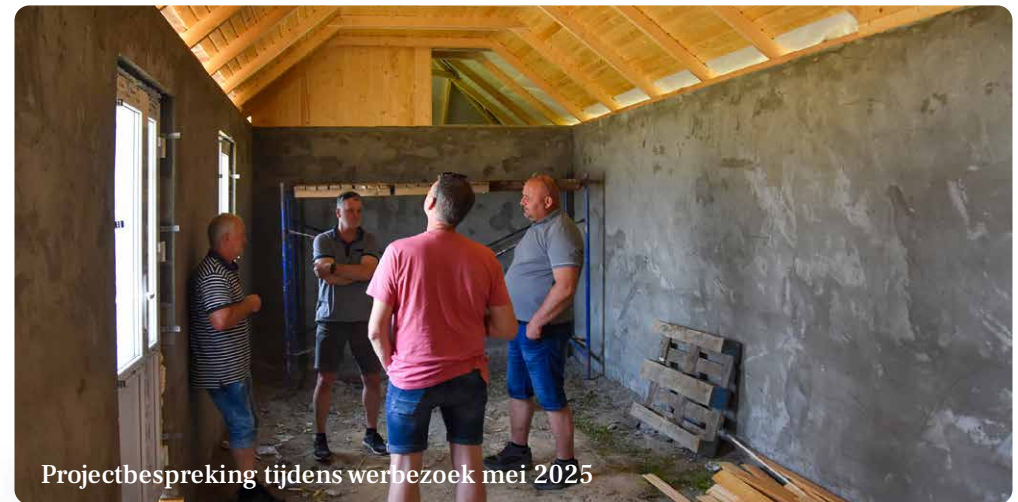
Projectbespreking tijdens werkbezoek mei 2025

Tijdens het laatstgehouden werkbezoek in juni bleek dat de bouw van het centrum al ver gevorderd is: de muren staan en men is druk bezig met de afwerking. De burgemeester heeft het initiatief genomen voor de bouw, voor het centrum dat vooral ten dienste wil staan van de minder bedeelden in de plaatselijke samenleving. Dit is een belangrijke reden voor Stichting OZO om aan dit initiatief mee te werken. Als het gebouw klaar is, zal er drie keer in de week worden gekookt. Voor deze warme maaltijden die gratis worden verstrekt worden arme dorpsbewoners uitgenodigd om mee te eten. Het zal dus een echte 'volkskeuken' worden. Verder zal het ook ingericht worden als een 'inloop huis' waar arme mensen een luisterend oor kunnen vinden.