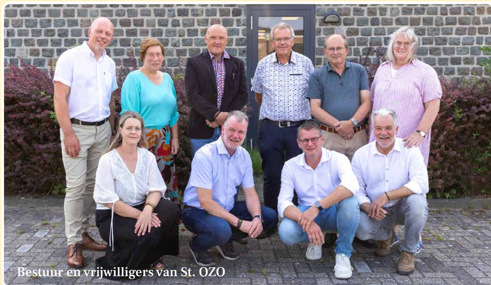
Bestuur en vrijwilligers van St. OZO