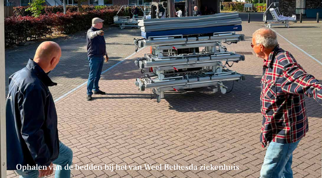
Ophalen van de bedden bij het van Weel Bethesda ziekenhuis

Half mei werden tijdens een omvangrijke 'operatie' 150 bedden van het ziekenhuis in Dirksland vernieuwd. De oude bedden en matrassen werden niet weggegooid. Maar ze werden ter beschikking gesteld voor hulporganisaties die voornamelijk werken in het oosten van Europa.