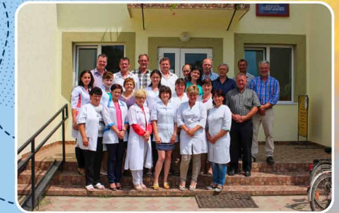
Personeel polikliniek Nagydobrony.

De polikliniek wordt opgeleverd en ziet er zowel van binnen als van buiten fraai uit.