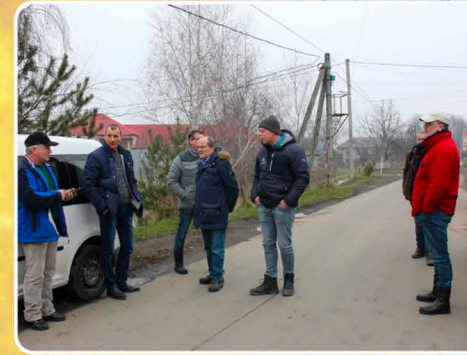
Het hulpverleningswerk blijft nog steeds hard nodig.