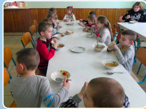
Dagelijkse warme maaltijden voor schoolkinderen.