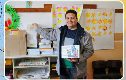
Overhandiging medische apparatuur.