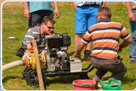
Uitbreiding algemene hulp.