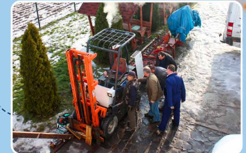
Groot onderhoud heftruck.