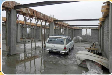
Een nieuwe tractor voor de boerderij.

Achter Rehoboth wordt een aanvang gemaakt met de bouw van een grote opslagschuur.