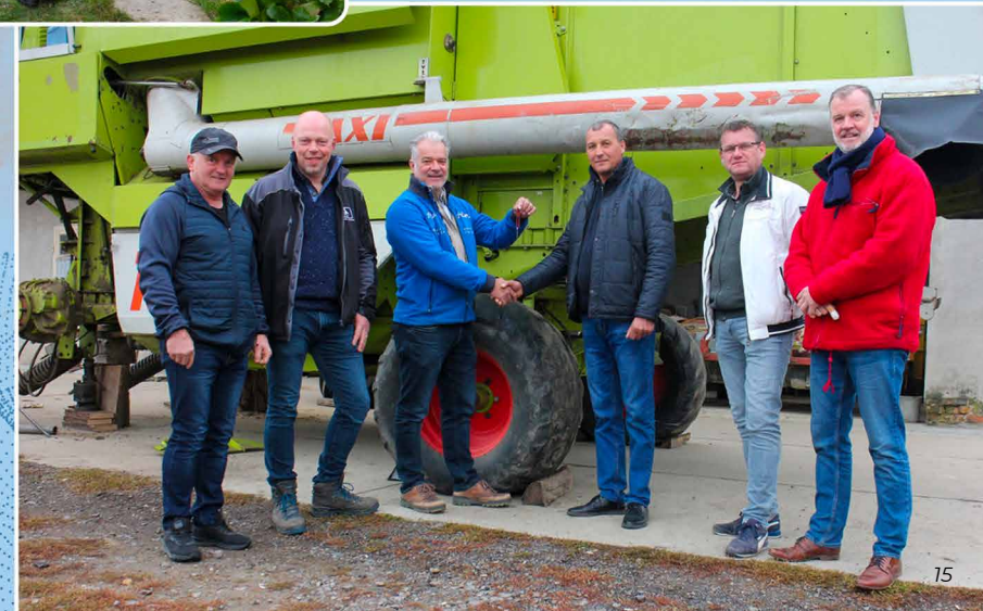
De nieuwe combine wordt officieel overhandigd.