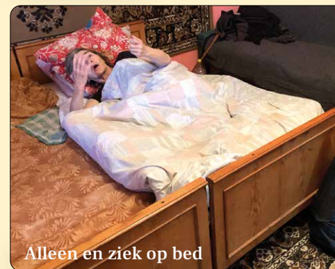
Alleen en ziek op bed