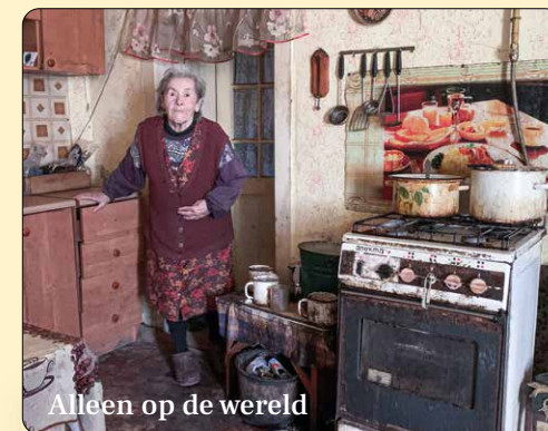
Alleen op de wereld