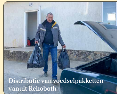
Distributie van voedselpakketten vanuit Rehoboth