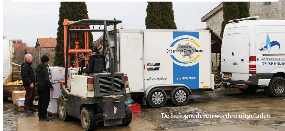
De hulpgoederen worden uitgeladen

Tijdens het werkbezoek werden de gebruikelijke bezoeken afgelegd. Een dagelijks verslag van het bezoek is te lezen op www.stichting-ozo.nl Elders in deze OC staan een aantal verhalen naar aanleiding van het werkbezoek. Er waren tijdens dit bezoek geen bijzondere karweien te doen. Daarom konden de deelnemers zich richten op het reilen en zeilen van Rehoboth en de boerderij. Verschillende zaken werden besproken. Het viel ook deze keer op hoe het personeel van Rehoboth, ondanks de onderbezetting, toch alles op alles zette om de bewoners een goed 'thuis' te bieden. Daarnaast wordt er ook aandacht besteed aan de