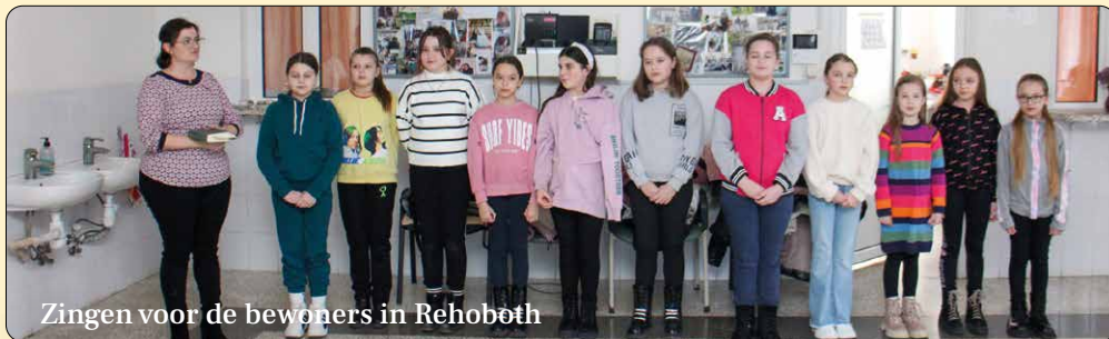
Zingen voor de bewoners in Rehoboth