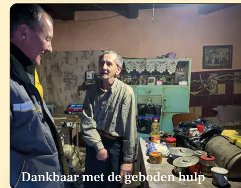
Dankbaar met de geboden hulp