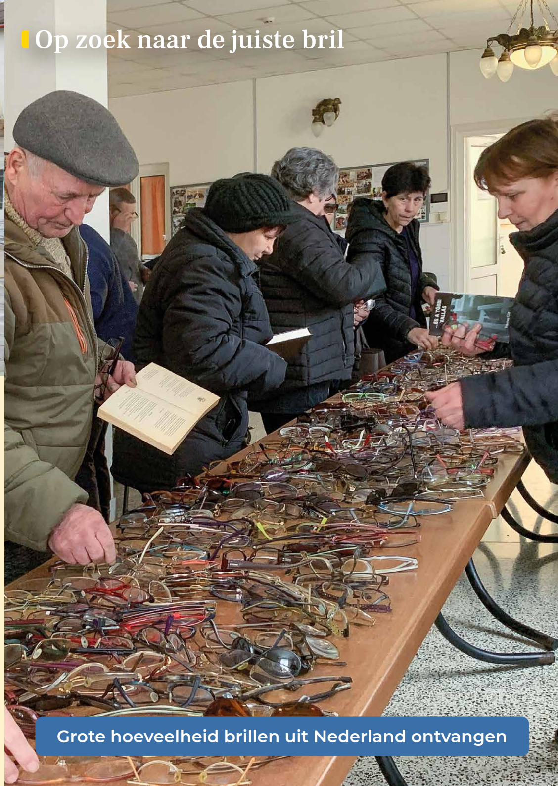
Grote hoeveelheid brillen uit Nederland ontvangen